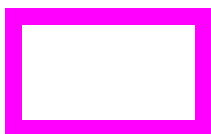
Area funzionale C - periferica