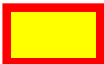
Area funzionale A – Centro urbano